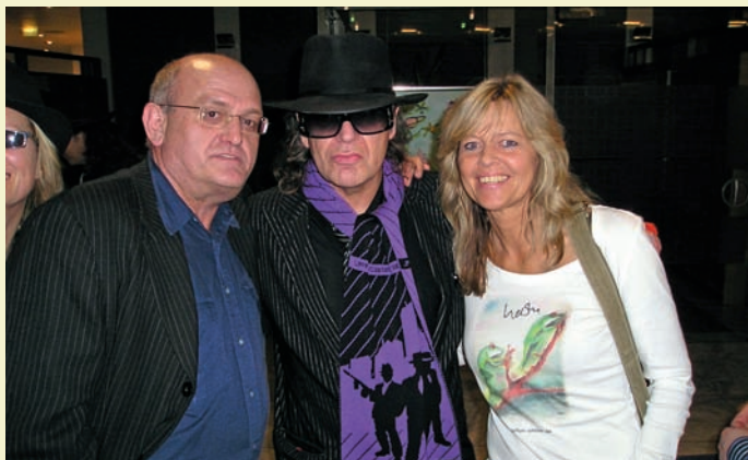
Udo Lindenberg hörte interessiert zu, als wir ihm von unserer Idee erzählten. Kreativität bei Menschen wecken ist „sein Ding“.

Im Rahmen des Projektes www.voelklingen-lebt-gesund.de erhielt ich den Auftrag ein Kinderkochbuch zu schreiben. Ich überlegte mir ein Konzept, welches genussvolle Elemente, sowie Freude an Kochen und Essen gleichermaßen tolerierte.